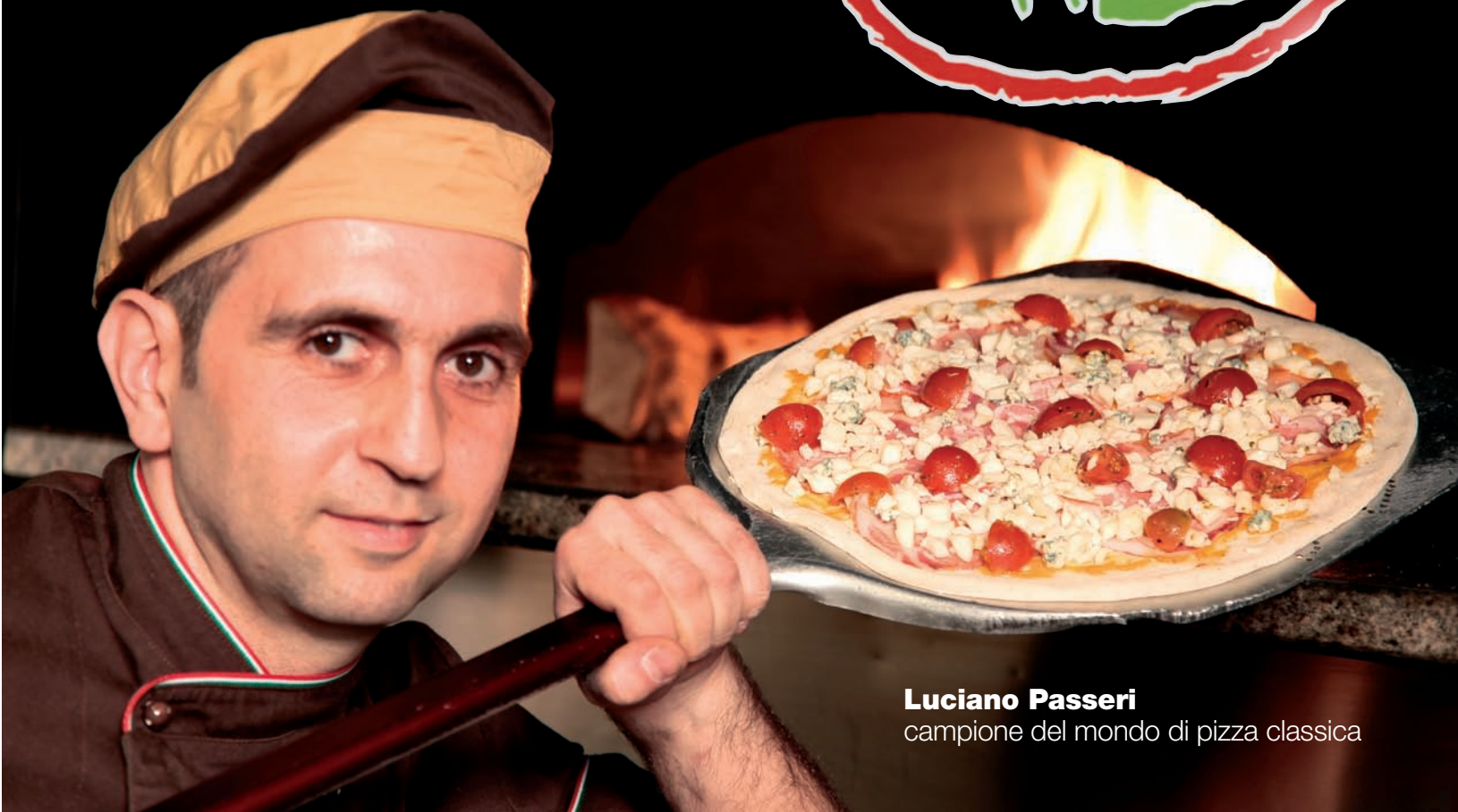
Luciano Passeri campione del mondo di pizza classica